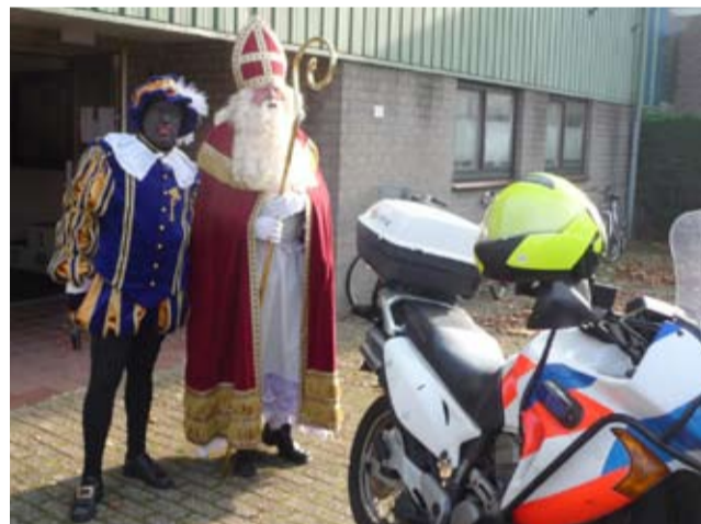
Sint-Nicolaas en de Hoofdpiet verlaten de sporthal ▲

Door de Peperstraat en de Symon Claeszstraat kwamen ze de Rosmolenwijk