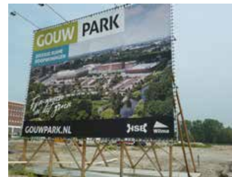
Aankondiging van Gouwpark ( Wilma Wonen ) Volgende pagina: Impressie van Gouwpark

Vanaf 1953 kwam in dit deel van het Oostzijderveld achtereenvolgens een bejaardentehuis en, in de jaren zestig, het Julianaziekenhuis (na een fusie met het Johannesziekenhuis respectievelijk De Heel en Zaans Medisch Centrum geheten). Met de bouw van het ziekenhuis zoals dat er nu staat, kwam er ruimte beschikbaar voor nieuwe woningen. In de zomer van 2021 werden de eerste huizen van Gouwpark opgeleverd.