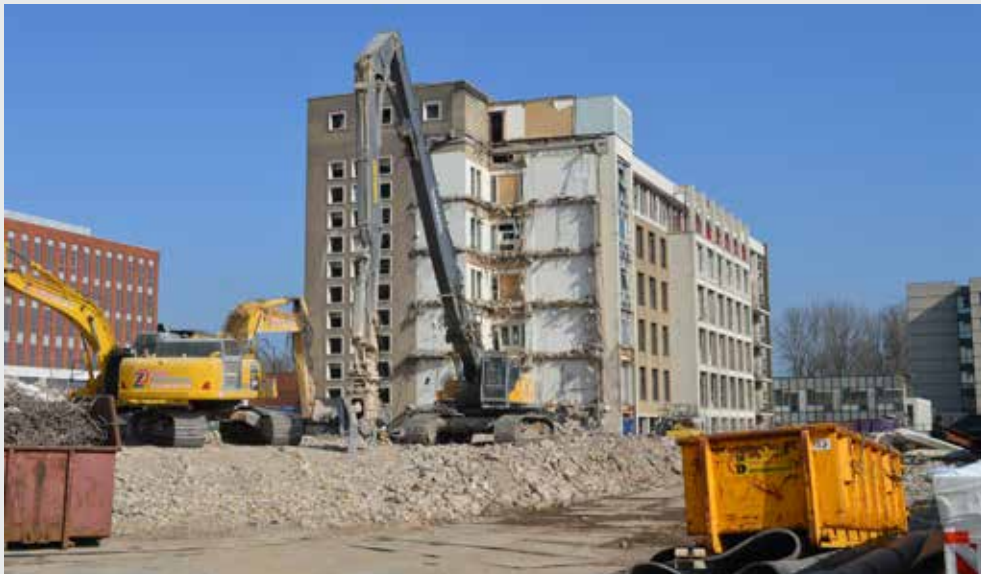
▼ De sloop van het oude ziekenhuis, dat plaatsmaakte voor woonwijk Gouwpark ( Erik Esteie )