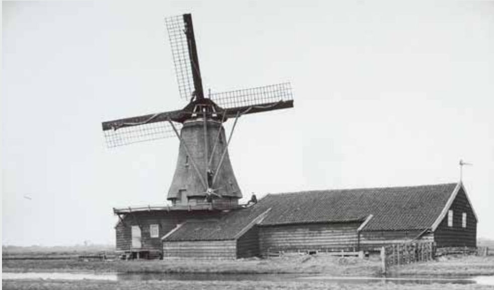
▲ Molen Koning William