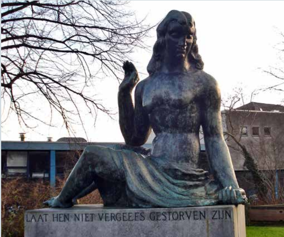
Oorlogsmonument Plantsoen van het Verzet

Op de lijsten werd ingezameld: fl. 11.878.04; aan giften, niet op de lijsten verantwoord, ontvangen fl. 900,- en de stortingen op de giro-rekening bedroegen fl. 1984.50.